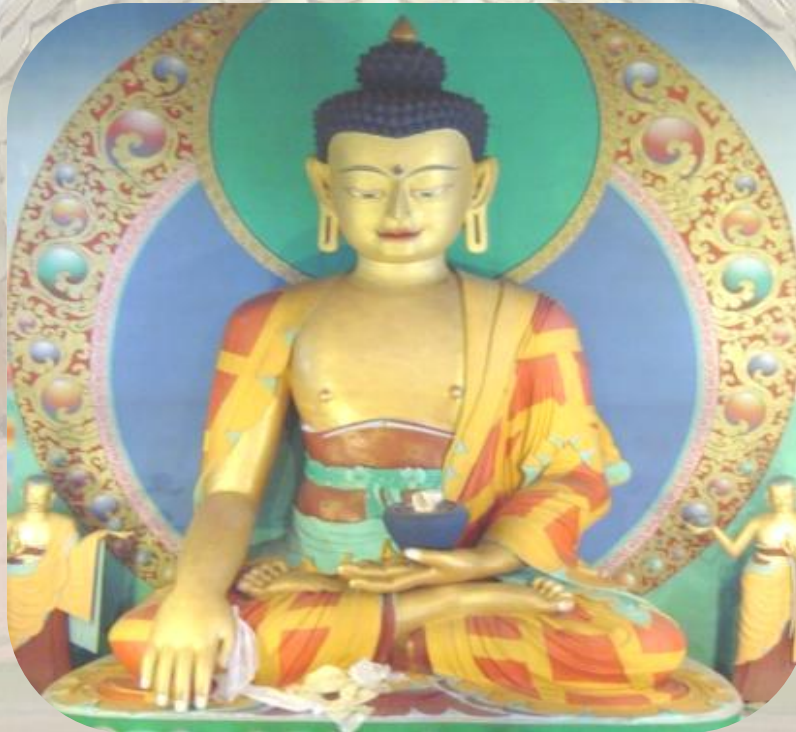
Le Bouddha Sâkyamuni. Statue du temple des mille bouddhas, la Plaigne, Bourgogne.

Une session plus complète détaille les différents points abordés dans ce document et se termine par un atelier.